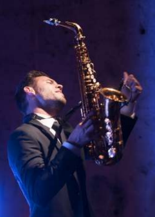
Ook ingevlogen voor het trouwfeest: de Bosnische band Hari Mata Hari.