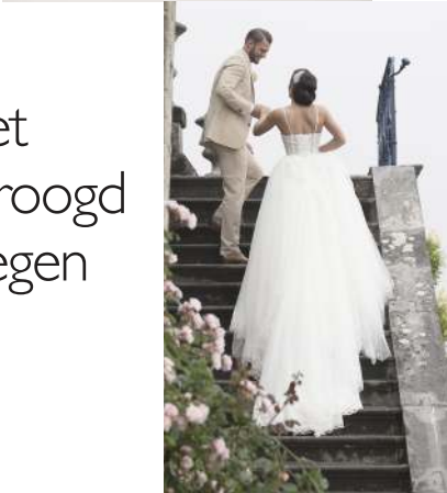
Diverse tripjes Londen-Amsterdam zorgden voor de perfect passende jurk.