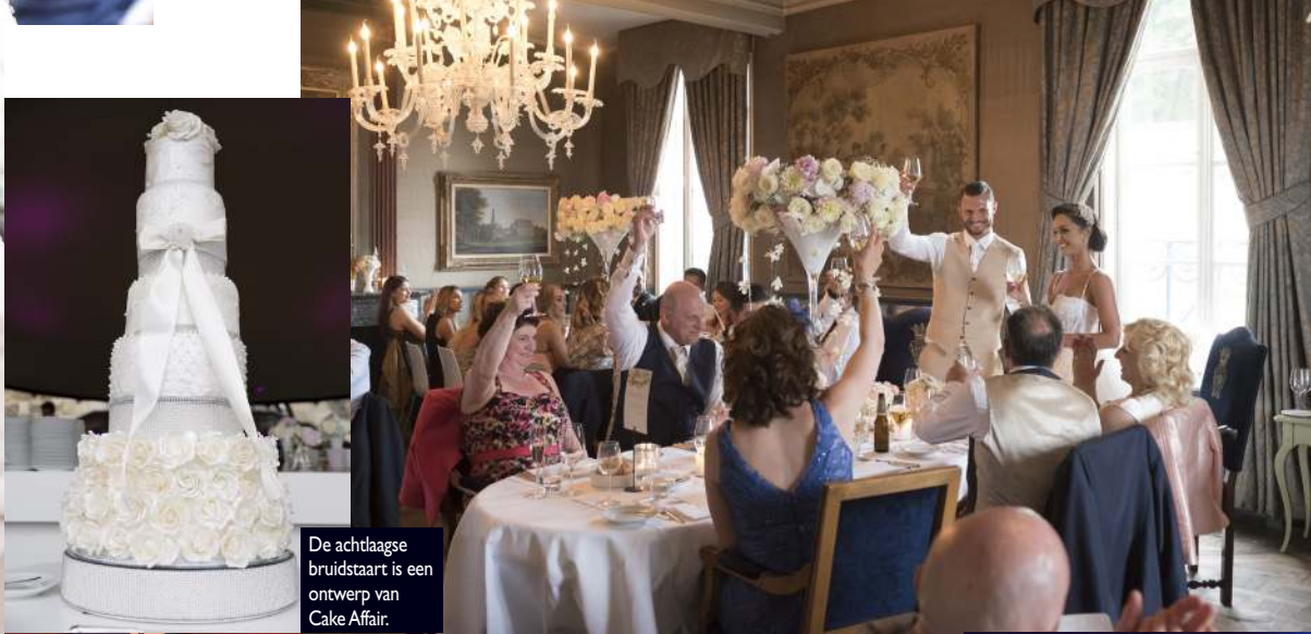
De achttalige bruidstaart is een ontwerp van Cake Affair.